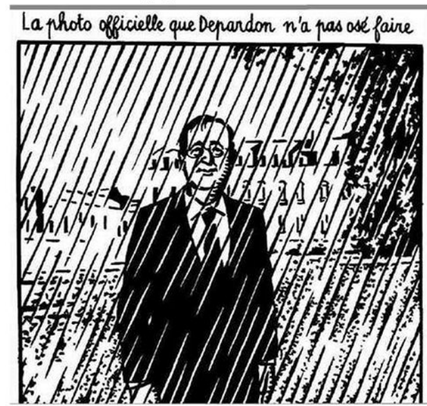
La météo présidentielle est toujours grise et pluvieuse

Cette petite anthologie lui rend hommage et vie à travers la sélection